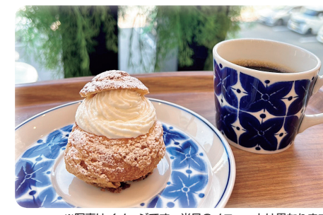
※写真はイメージです。当日のメニューとは異なります。